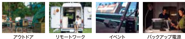
アウトドア リモートワーク イベント バックアップ電源